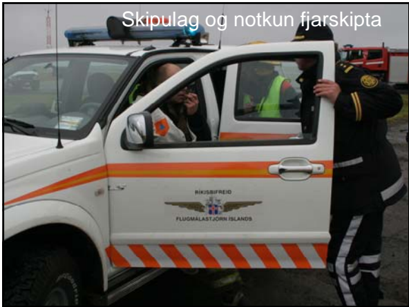
Skipulag og notkun fjarskipta