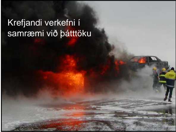
Krefjandi verkefni í samræmi við þáttöku