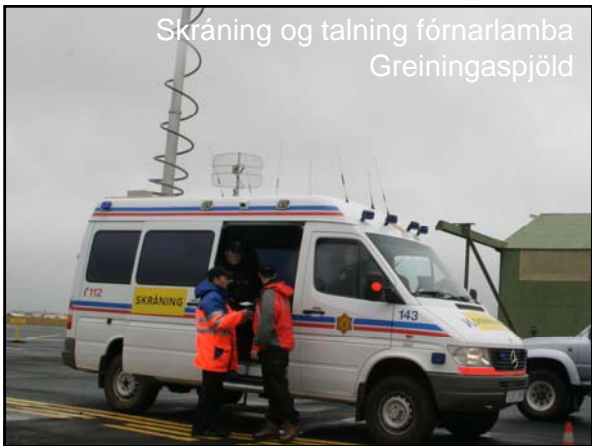
Skráning og taling fórnarlamba Greiningaspjöld